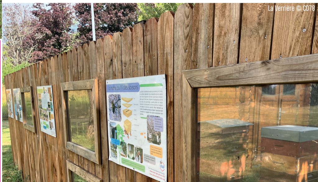
La Verrière

Toutes les informations pratiques et le règlement complet sont disponibles sur : www.destination-yvelines.fr/villes-et-villages-fleuris